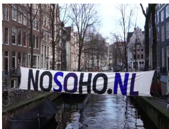
Buurtprotest tegen hotelvestiging

Ook werd eind 2013 een advies uitgebracht over locaties voor ouderenhuisvesting in relatie tot de plannen voor de vestiging van een Soho hotel in het Centrum.